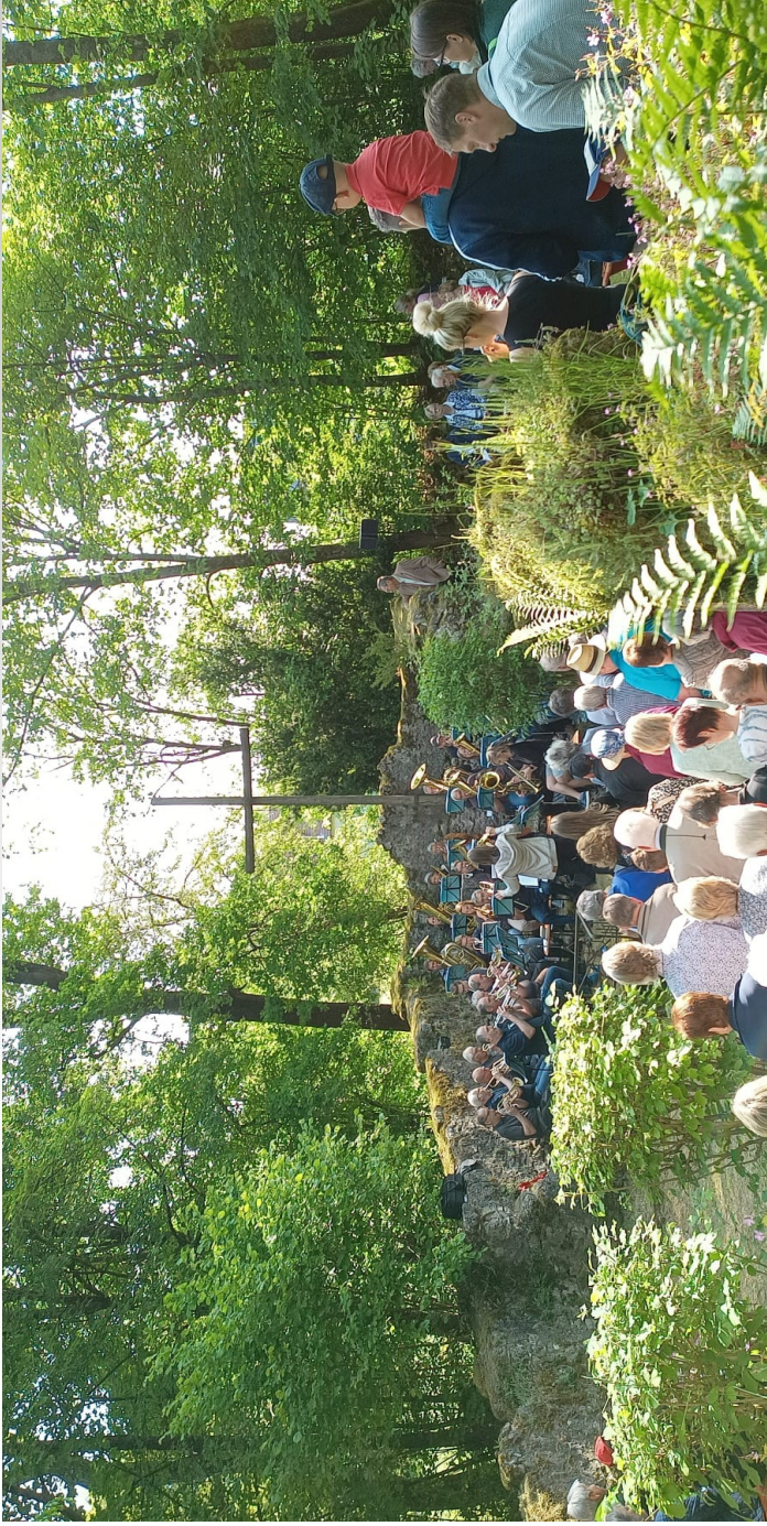
Unser Familiengottesdienst am Dietersberg am Pfingstsonntag