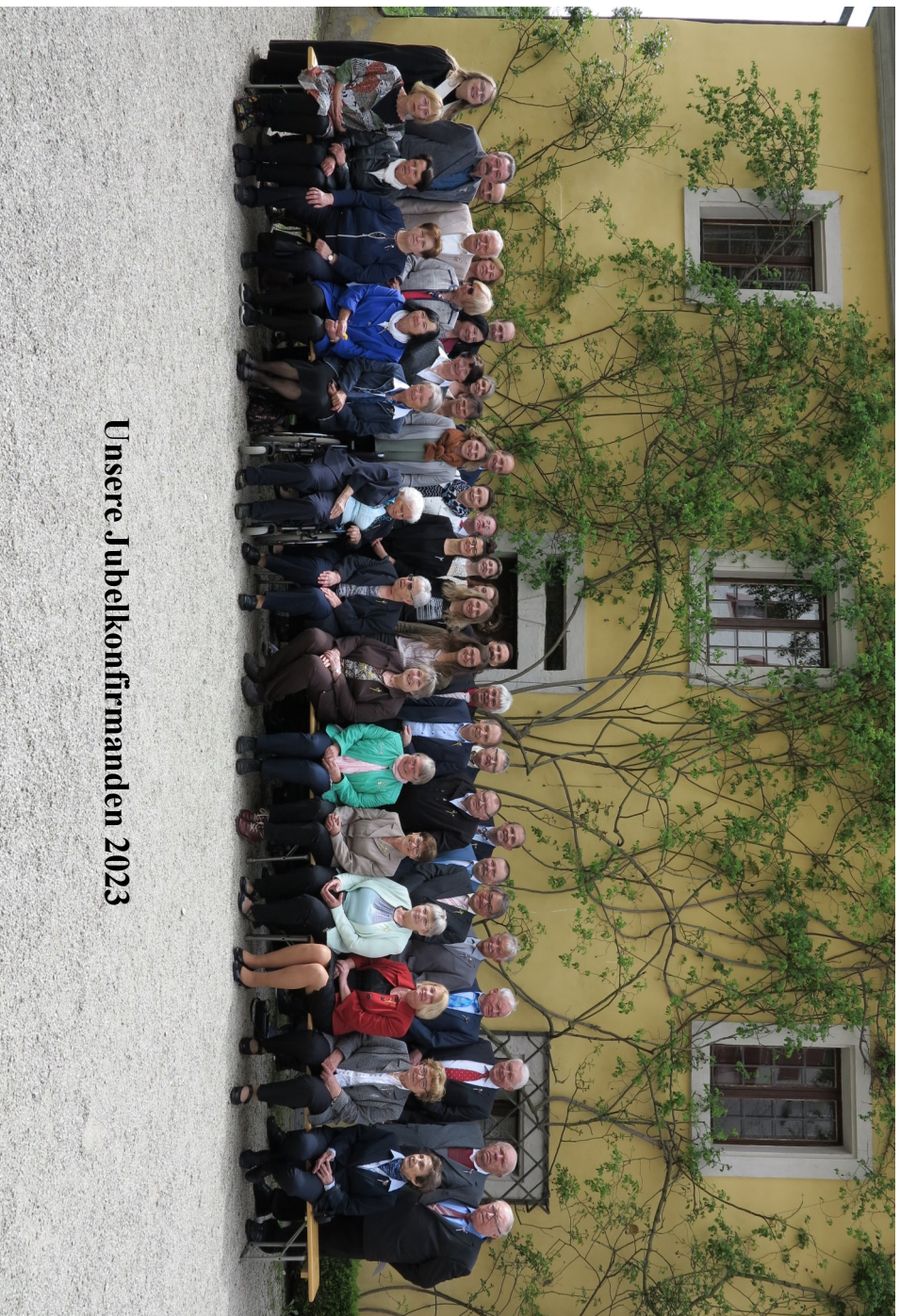
Unsere Jubelkonfirmanden 2023